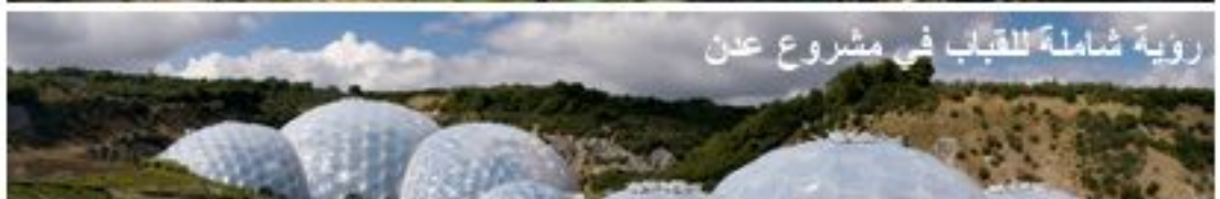
رؤية شاملة للقباب في مشروع عدن