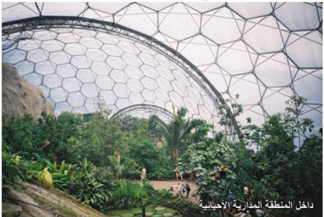
داخل المنطقة المدارية الأحيائية

وهو مجمع بيئي صناعي ضخم ويقع في كورنوال وهي مقاطعة إنكليزية ساحلية جنوب غرب إنكلترة وبالقرب من بلدة صغيرة أوستل سانت حيث الهدوء والابتعاد عن الطرق الصاخبة تم بناء هذا المشروع وهي المحمية النباتية الأكبر في العالم ويعتبر أفضل مشروع للمحافظة على نباتات وكنوز الطبيعة في هذه الأرض فهو أكبر تجمع للنباتات